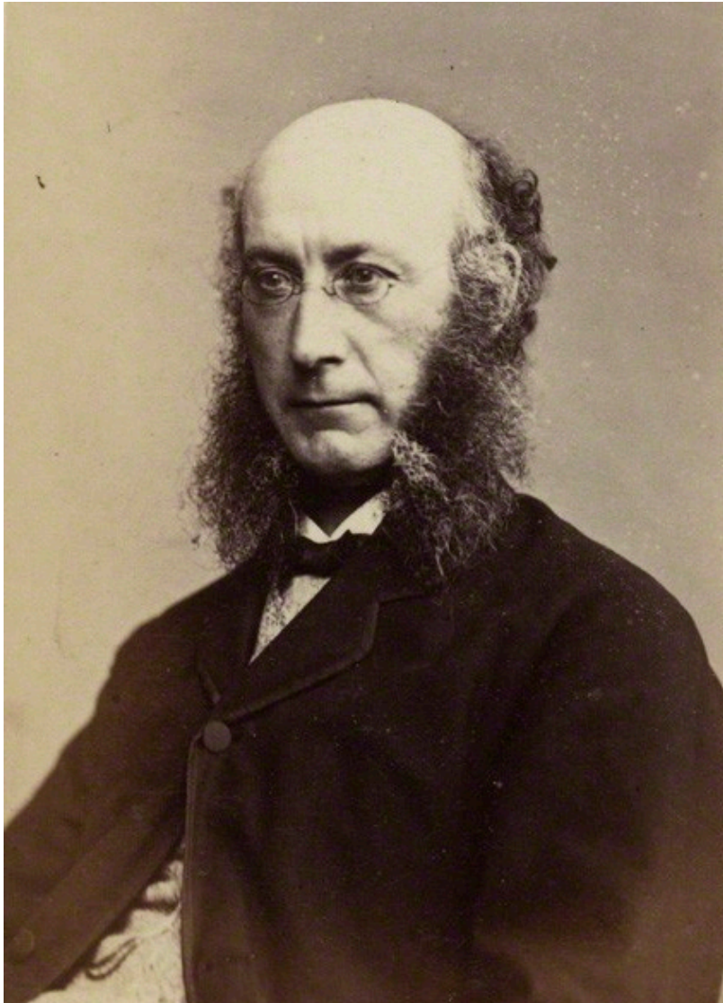
Robert Bentley by Henry Joseph Whitlock – albumen carte-de-visite, 1860s.

A continuación de la traducción literal de su biografía publicada en el “Dictionary of National Biography – suplemento 1” :